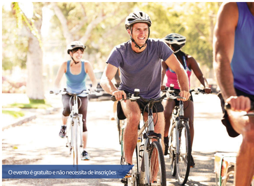
O evento é gratuito e não necessita de inscrições

O Abraço Ciclístico conta com a colaboração da Polícia Rodoviária Federal (PRF), Policiamento de Trânsito da Capital (CPRE), Polícia Militar (PM), Corpo de Bombeiros Militar (CBM), Serviço de Atendimento Móvel de Urgência (SAMU), Secretaria Municipal de Esporte e Lazer (SEL), Secretaria Municipal de Mobilidade Urbana (STTU) e o Instituto de Desenvolvimen-