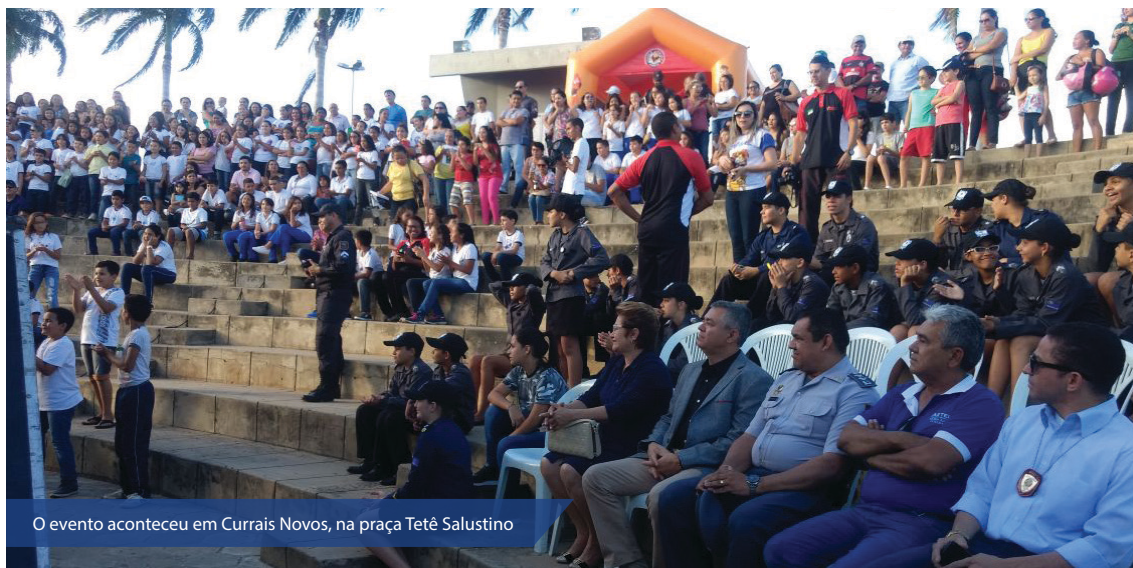
O evento aconteceu em Currais Novos, na praça Tetê Salustino

Somente neste primeiro semestre, foram quase 8 mil alunos atendidos em todo o Estado. Para o final do ano, a estimativa é que mais de 15 mil crianças e adolescentes tenham contato com o Proerd.