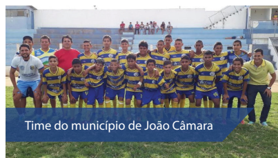
Time do município de João Câmara

Os resultados das quartas de final tiveram a seleção de Goianinha vencendo Natal nos pênaltis por 4 a 3. Ipanguaçu carimbou a vaga ao bater Jucurutu por 3 a 2. No terceiro jogo, a seleção de São Tomé garantiu a vaga nos pênaltis batendo o Santa Cruz por 6 a 5. A última partida foi entre Currais Novos e João Câmara, os curraisnovenses venceram por 1 a 0, mas não foi o suficiente para